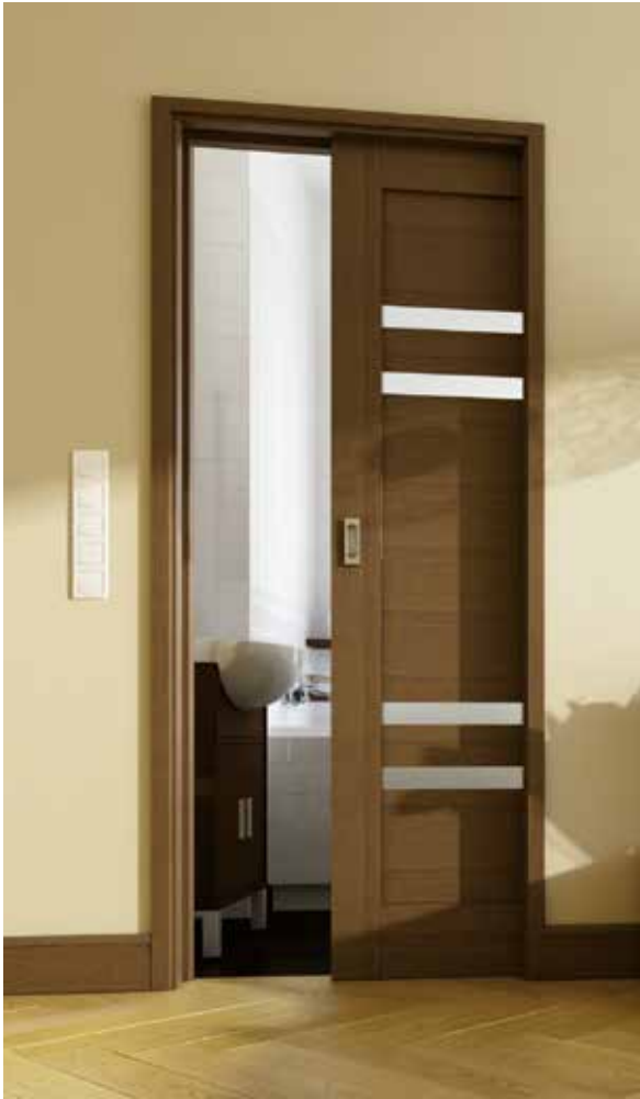
SHEMA PODBOJA VRAT ZA DRSNI SISTEM (sistem mavčnih sten)